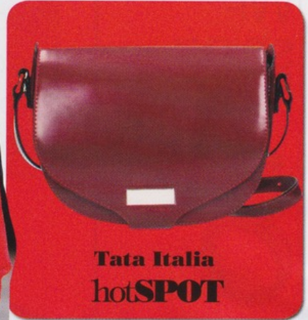
Tata Italia hotSPOT