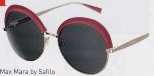
Max Mara by Safilo