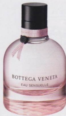
Bottega Veneta Eau Sensuelle EDP